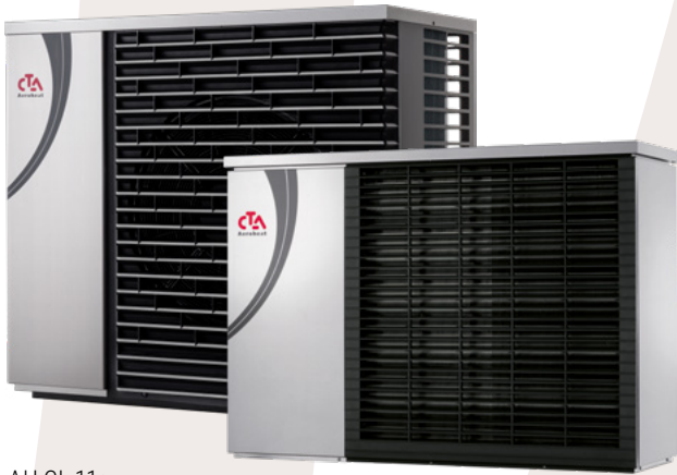
AH CL 11a AH CL 16a

Vier verschiedene, auf das Gesamtsystem abgestimmte Inneneinheiten sowie vorgefertigte elektrische und hydraulische Anschluss-Sets sorgen für eine einfache Installation. Bis zu vier Geräte sind kaskadierbar.