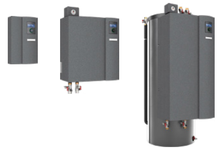
v.l.: Installationsbeispiel Ausseneinheit, Innensicht mit CL Hydraulikmodul Livera, Varianten der Livera Inneneinheiten